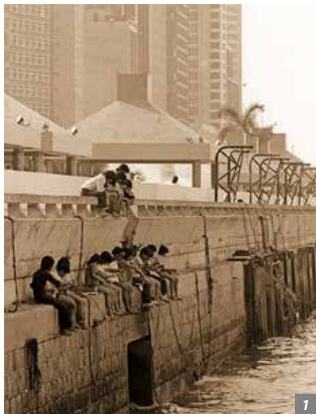
1-2. 中环闲钓活动一九八零年 与今日对比。