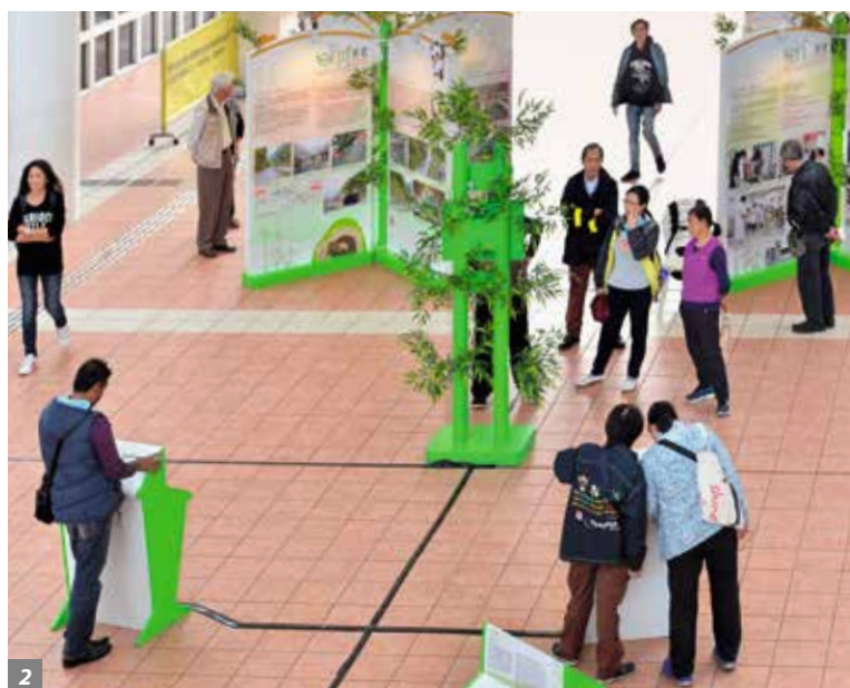
1-2. “香港特区支援四川地震灾后重建”巡回展览在十月至十二月期间举行。