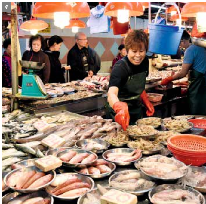
3-4. 香港仔鱼市场一九七九年 与今日对比。