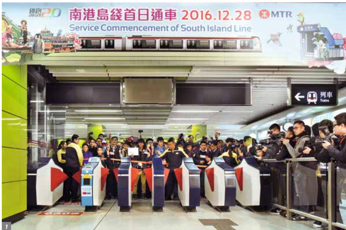
年底，港铁南港岛线通车(1)， 红磡港铁学院开幕(2)。