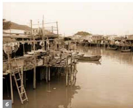
5-6. 大澳今日与 一九八二年对比。