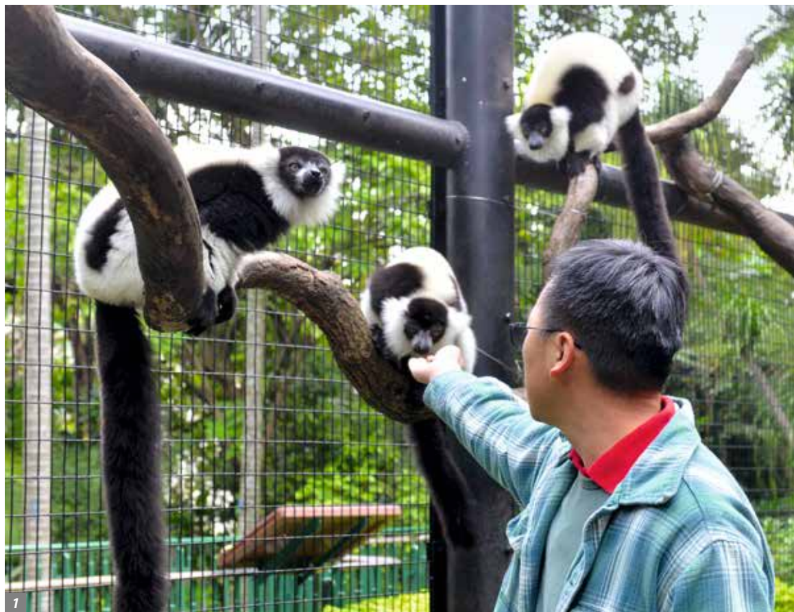
香港动植物公园饲养的领狐猴 (1) 和皇狨猴 (2) 属稀有品种。