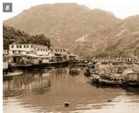
7-8. 南丫岛索罟湾今日与 一九七七年对比。