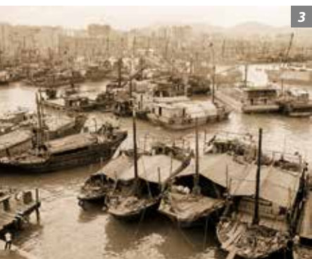
3-4. 油麻地一九六七年与 二零一六年对比。