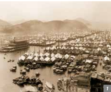
1-2. 香港仔一九六五年与 二零一六年对比。