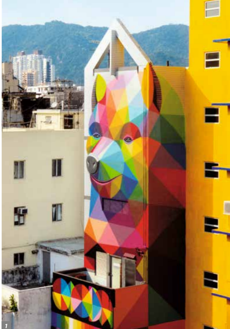
1. 深水埗的“香港街头艺术节”壁画。