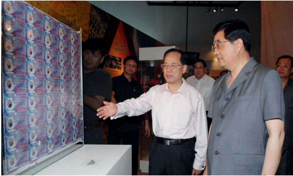
行政長官與國家主席胡錦濤（上圖）、總理溫家寶參觀六月在北京舉行的“香港特別行政區十周年成就展”。這次展覽是香港特區成立十周年的慶祝活動之一，展品包括上圖可見的新發行拾元塑質鈔票。