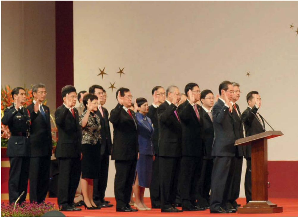
上圖：在香港特別行政區第三屆政府就職典禮上，國家主席胡錦濤為主要官員監誓。