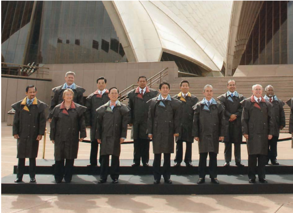
上圖：第十五屆亞太區經濟合作組織經濟領導人會議九月在悉尼舉行，與會領袖，包括香港行政長官，穿上澳洲傳統大衣亮相。右圖：數碼地面電視在十二月三十一日啟播，標誌着香港進入新紀元。視聽器材展覽會的參觀者，對最新型的高清電視機極感興趣。