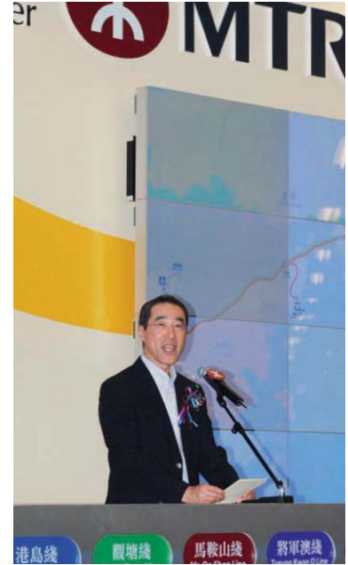
上圖：慶祝地下鐵路和九廣鐵路系統合併的典禮在十二月二日舉行，政務司司長唐英年在席上致辭。