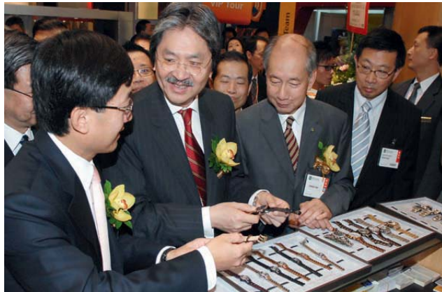
右圖：財政司司長曾俊華參觀在九月舉行的香港鐘表展2007。該展覽吸引了來自18個國家和地區共八百多個參展商參加。